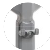
Wygodny haczyk na narzędzia