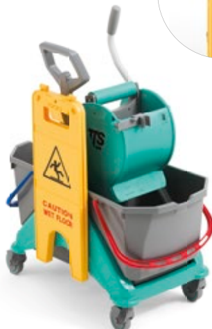
Haczyk na sygnalizator