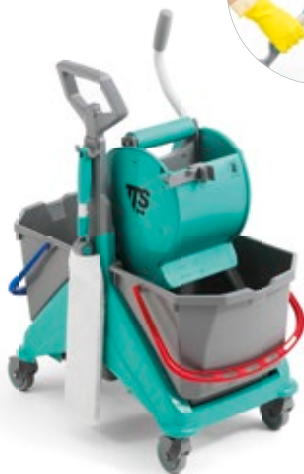
Haczyk do BIT/Bendy