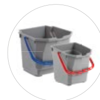
Wiadra kodowane kolorami

DESIGN: profesjonalnie wykonany, zgrabny i stylowy, dopasowuje się do każdego pomieszczenia.