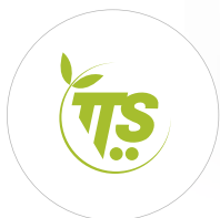
Wykonany z przetworzonego plastiku (PSV) Zgodny z normą CAM*