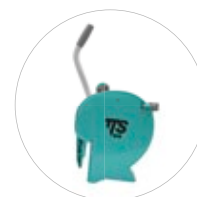
Kompatybilny ze wszystkimi wyciskarkami