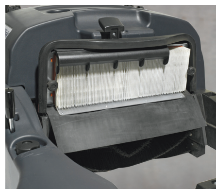
Dzięki zastosowaniu filtra poliestrowego zamiatarka może pracować zarówno z suchymi, jak i mokrymi zanieczyszczeniami.