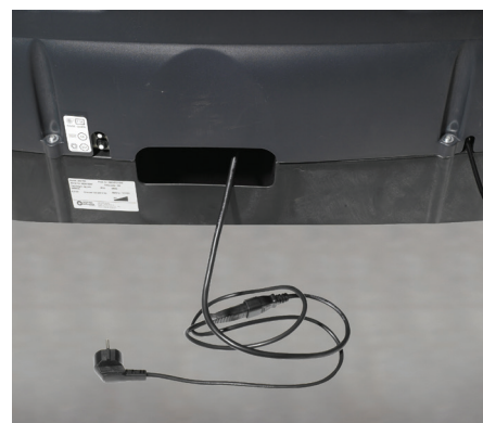
Wbudowana ładowarka zapewnia bezproblemowe funkcjonowanie.